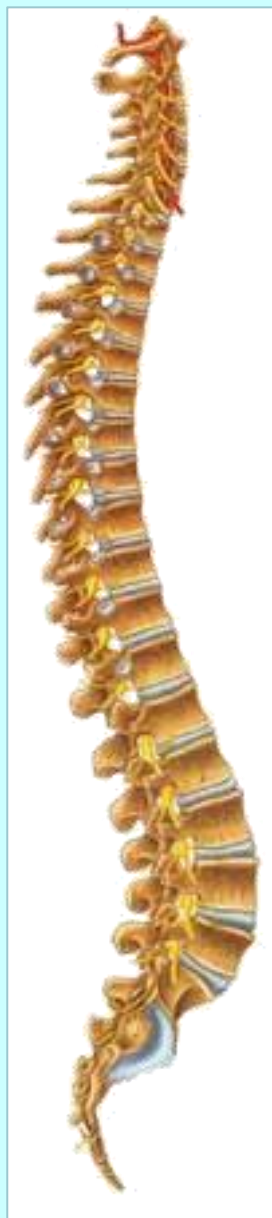
Pogled na hrbtenjačni steber.