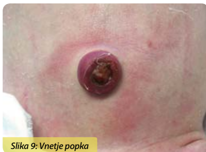
Slika 9: Vnetje popka

Vnetje popka (omfalitis) se kaže z rdečino, oteklino ter gnojnim in smrdečim izcedkom. Vname se navadno zaradi okužbe s škodljivimi bakterijami, ki se na popek naselijo zaradi pomanjkljive higiene rok negovalca. (5) Pri blagi obliki vnetja z rdečino brez oteklina, gnojnega izcedka in smrdečega vonja lahko zadošča lokalno zdravljenje oz. toaleta popka s primerno raztopino razkužila, ki uniči bakterije. Pri težji obliki vnetja popka