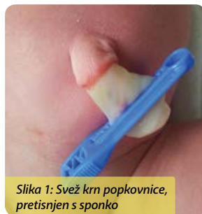
Slika 1: Svež krn popkovnice, pretisnjen s sponko

Zaradi sušenja krn med 5. in 14. dnevom po rojstvu odpade; čas sušenja je lahko daljši pri novorojenčkih, rojenih s carskim rezom, ter pri nedonošenih in zahiranih (prelahkih) novorojenčkih.