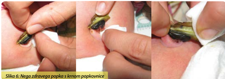
Slika 6: Nega zdravega popka s krnom popkovnice

Če se popka še drži krn popkovnice, najprej očistimo okolico popka z enkratnim krožnim potegom zloženca, nato krn privzdignemo in ga z enkratnim potegom očistimo od spodaj navzgor ter končamo s čiščenjem sponke popkovnice, če jo novorojenček še ima. Postopek ponavljamo toliko časa, dokler ni popek čist.