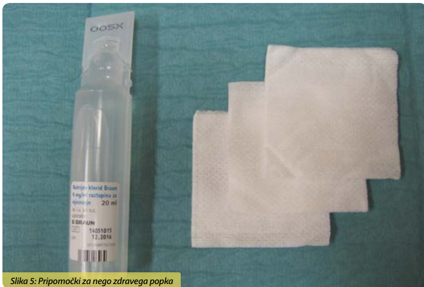
Slika 5: Pripomočki za nego zdravega popka

Zdrav popek negujemo enkrat na dan oz. večkrat, če je onesnažen z blatom ali urinom.