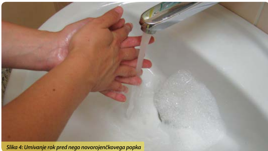
Slika 4: Umivanje rok pred nego novorojenčkovega popka

Roke si je potrebno dodatno umiti, če so umazane z blatom, urinom ali drugimi izločki ter po uporabi stranišča. Na higieno rok je treba paziti tudi po uporabi elektronskih naprav, kot so telefoni, tipkovnice in prenosni računalniki, saj so polni mikrobov.