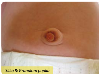
Slika 8: Granulom popka

Po odpadu krna popkovnice nastane v ležišču popka obnovitveno granulacijsko tkivo, iz katerega se tvori nepopolno epitelizirana tanka plast kože oziroma brazgotina, ki postopoma prekrije cel popek. V primeru draženja na račun dolgotrajnega izcedka ali močnejše bakterijske kolonizacije je ta proces moten in granulacijsko tkivo se pomnoži bolj kot navadno. Posledica je nastanek granuloma, pecljatega mesnatoga