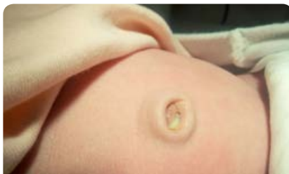
Slika 10: Dolgotrajen gnojen izcedek iz popka zaradi ostanka povezave med popkom in sečnim mehurjem

Dolgotrajen izcedek iz popka je prisoten več kot dva tedna po odpadu krna popkovnice. Vzrok zanj je lahko ostanek povezave med popkom in sečnim mehurjem, imenovan urahus, ali ostanek povezave med popkom in tankim črevesom, imenovan omfaloenterični vod. Izcedek preprečuje popolno zacelitev popka in je lahko vzrok za nastanek vnetja, granuloma ali granulomu podobnega tkiva popka. Ob dolgotrajnem izcedku iz popka je potreben pregled pri pediatru in v primeru zapletov tudi usmerjeno zdravljenje.