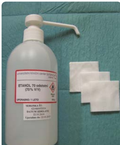
Slika 11: Pripomočki za nego popka s tveganjem in bolnega popka

Po negi krna popkovnice ali ležišča popka pustimo, da se razkužilo samostojno posuši. Po končani negi popka novorojenčka oblečemo in si umijemo (ali razkužimo) roke.