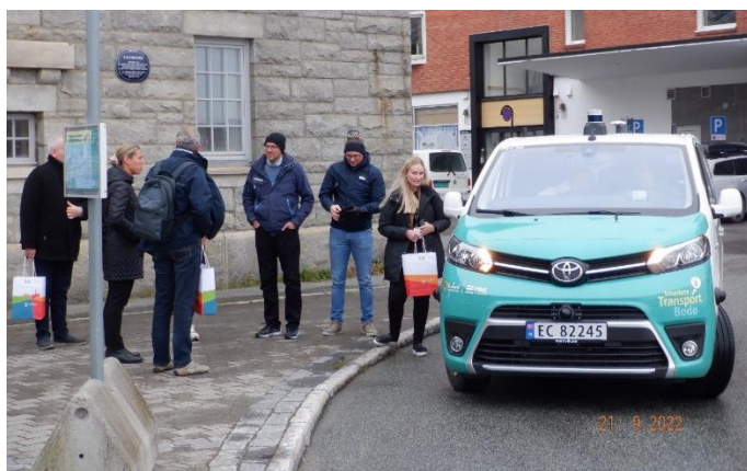
Slika 3: Predstavniki partnerjev projekta, regije Nordland ter bolnišnice v Bodu pred vožnjo z avtonomnim vozilom

V času od 19. do 22. septembra smo se predstavniki Razvojnega centra Novo mesto, Splošne bolnišnice Novo mesto in Mestne občine Novo mesto udeležili študijskega obiska v Kraljevini Norveški v mestu Bodø, kjer smo se srečali s predstavniki univerze NORD, regije Nordland in bolnišnice v Bodu. Med obiskom smo si izmenjali izkušnje o urejanju in upravljanju površin za promet na območjih bolnišnic Bodø in Novo mesto, do bolnišnice v Bodu pa smo se zapeljali z avtonomnim vozilom, ki je rezultat projekta » Smartere transport Bodø «.