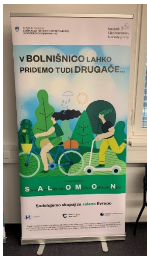
Slika 4: Roll-up projekta v Splošni bolnišnici Novo mesto

(seznanitev vseh zaposlenih v SB NM preko elektronske pošte). Partner projekta SB NM je v sodelovanju z ostalimi partnerji izdelal Komunikacijski načrt projekta z namenom izboljšanja komunikacije med partnerji ter jasnim pregledom aktivnosti, ki jih mora izvesti vsak projektni partner.