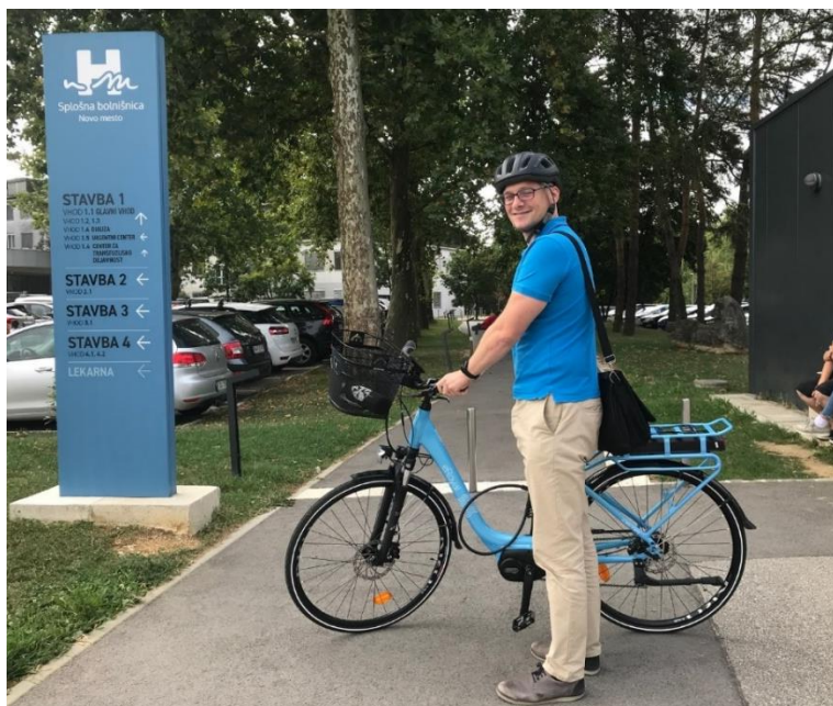
Slika 2: Predstavnik RC NM z e-kolesom

Za nemoteno izvedbo projekta in posameznih projektih nalog je bil s strani partnerja SB NM izveden nakup tabličnega računalnika, Razvojni center Novo mesto pa je izvedel nakup dveh e-koles za namen opravljanja službenih poti.